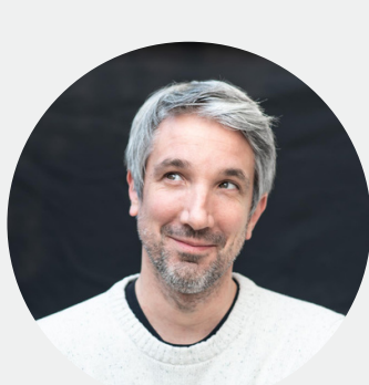
GUILLAUME MEURICE Humoriste