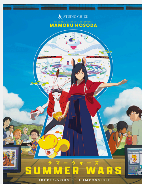
SUMMER WARS de Mamoru Hosoda