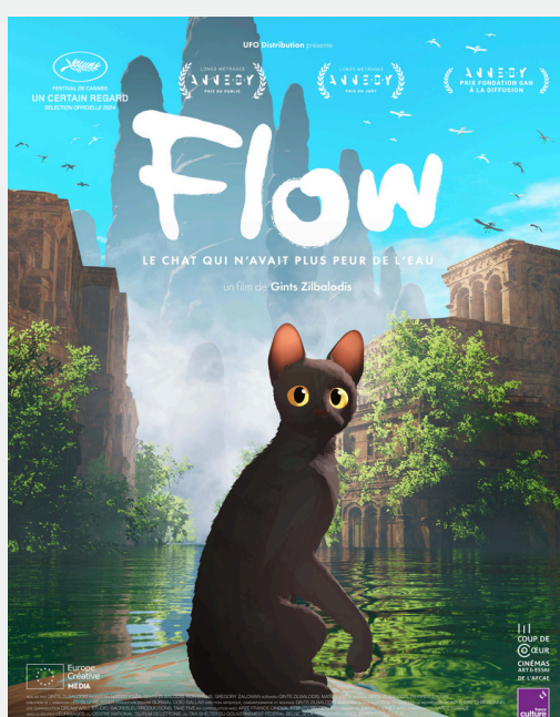
FLOW, LE CHAT QUI N'AVAIT PLUS PEUR DE L'EAU de Gints Zilbalodis