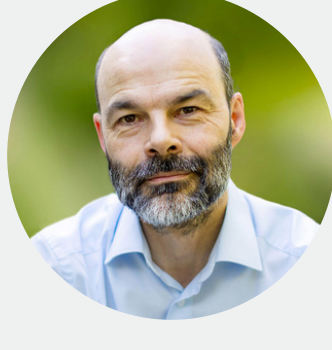
ROLAND LEHOUCQ Astrophysicien Président des Utopiales