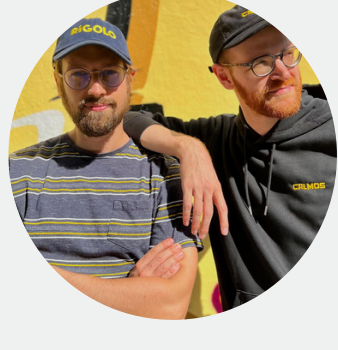
CALMOS Créateurs web