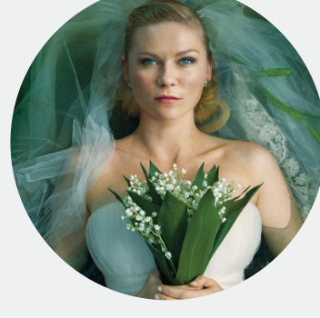
MELANCHOLIA de Lars Von Trier

Si vous souhaitez venir seule.e ou accompagné.e à la soirée d'ouverture des Mycéliades, merci de nous répondre par email afin que nous vous inscrivions.