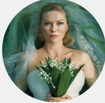
MELANCHOLIA de Lars Von Trier

Si vous souhaitez venir seul.e ou accompagné.e à la soirée d'ouverture des Mycéliades, merci de nous répondre par email afin que nous vous inscrivions.