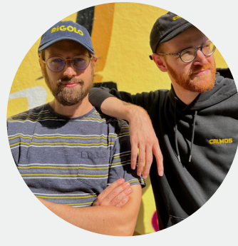
CALMOS Créateurs web